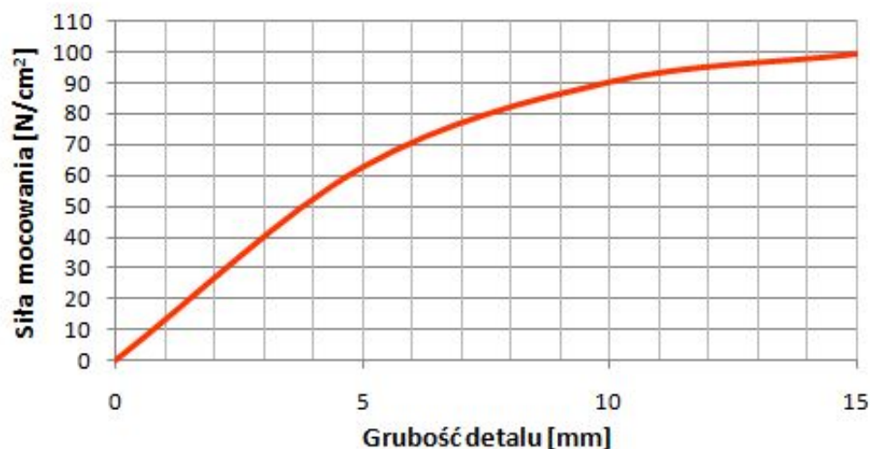
Wykres siły mocowania w zależności od grubości detalu

(badania zostały przeprowadzone dla płytek o wymiarach 20 x 20 mm wykonanych z żelaza armco)