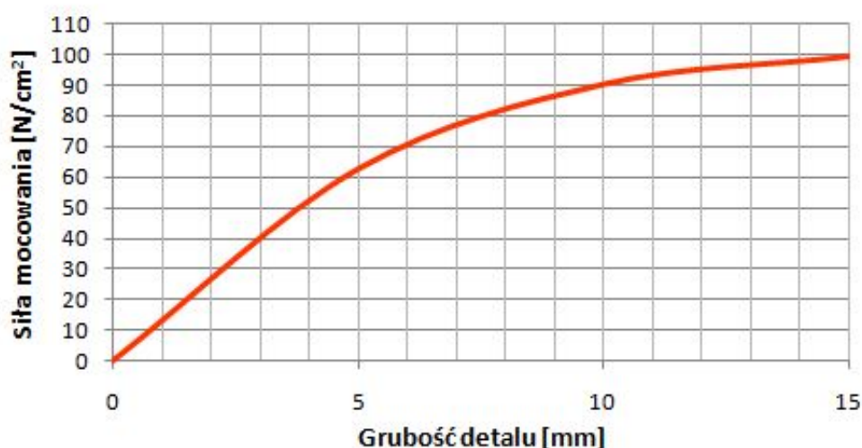
Wykres siły mocowania w zależności od grubości detalu